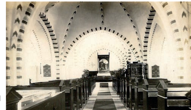
Kirken efter 1920

hvælv. Kirken blev før restaureringen opvarmet med en stor kakkelovn (rigtige kakler), efter istandsættelsen af et kalorifere fyr. Se på den fine kakkelovn på billedet før restaureringen