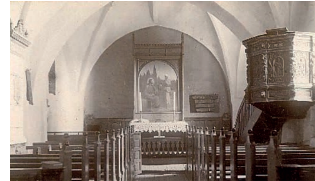
Kirken før 1919

hvælv og ribber blev der malet røde dekorationer, det var meget populært på dette tidspunkt, hvor det blev anset for at være "rigtig" middelalder. Der blev malet to røde dekorationer på hver side af altertavlen på korets nordvæg.